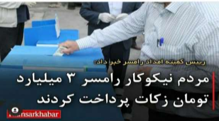
رییس کمیته امداد رامسر خبر داد: