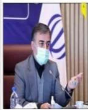
استاندار مازندران در جلسه ستاد تسهیل و رفع موانع تولید مازندران

مگر، مازندران می‌باید که احتیاط می‌رود چون به شکل جنین در خطر باشد و رادناجات مادر منحصر به سقط جنین بوده و من چنین کمتر از چهل ماه باشد و اینکه وجود مشکلات غیر قابل تحمل برای مادر و وجود خطری انفجاری چنین غیر قابل درمان در چنین باشد ایجاد - و بعد در مراکز پزشکی قانونی استان تشکیل و کمترین مشکل از یک قاضی ویژه منصوب است معجز بود، لایحه، یک پزشک متخصص متعهد و یک متخصص پزشکی قانونی در استفاده پزشکی قانونی بررسی می‌شود و پس از بحث و بررسی مدارک لازم، رای توسط قاضی کمترین صادر می‌شود.