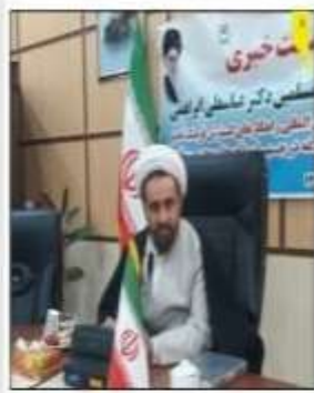
حجت‌الاسلام آبراهیمی خیر کنگره بین‌المللی گسترش فرهنگ غدیر خیر داد

نوگو مردیم! باید مشکلات آنان را بدون منت حل کنیم