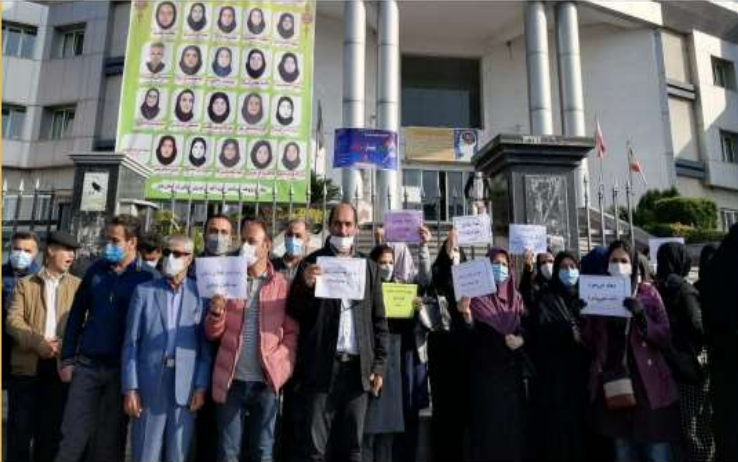
تجمع اعتراضی فرهنگیان شهرستان بابل