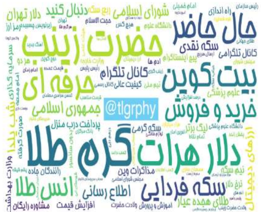
ابرواژه مطالب کانال‌های فارسی تلگرام در ۲۴ ساعت گذشته (برحسب مجموع بازدید)