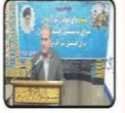
مدیرکل تعاون مازندران خبر داد: اجرای طرح آبرسانی ۱۵ روستای منصور گنده‌بابل