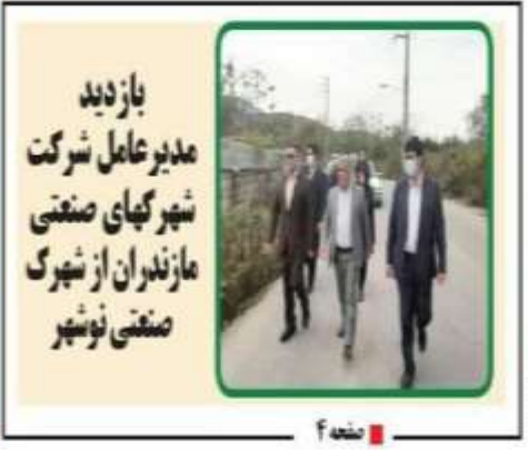
بازدید مدیر عامل شرکت شهر گهای صنعتی مازندران از شهرک صنعتی نوسا

مدیرکل آموزش و پرورش مازندران در جلسه شورای توان عزت و منزلت کودکان شوریه نوسازی قرآن پژوهی در مطبخ مدارس ۲ صفحه حفاظت از اراضی حرم ائمه در مسیر کارفرزانت اجرای عملیات روستایی مناطق شور دستچاق بل و امضا نور بدوکتار ۲ صفحه رئیس اداره بهداشت و امور بهداشتی مدارس مازندران وقت زین ۱۵ ساله برای احداث منزل مسکونی نایب‌رئیس در عملیاتی ۳ صفحه