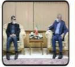
فعال سازی میدان نفت و گاز گلستان

با بیگیری های بعمل آمده در سال جاری سقف تسهیلات بهسازی و نوسازی واحدهای ثانویه از ۴۰۰ میلیون ریال به ۸۰۰ میلیون ریال افزایش یافت.