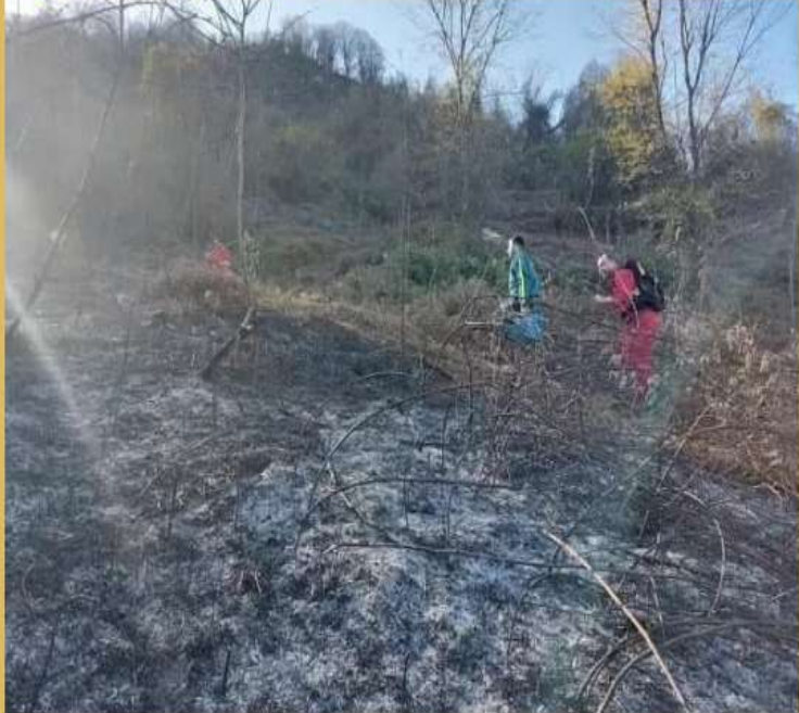
۱۰۷ هکتار از جنگل‌های غرب مازندران سوخت