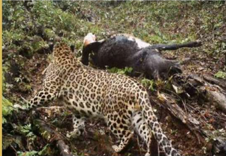
دوراهی دامداران و حیات وحش!

◆ جبران خسارت حمله حیوانات وحشی به دام‌های اهلی یکی از نگرانی‌های دامداران مازندرانی است ، مدیرکل حفاظت محیط زیست مازندران می‌گوید: قانون هیچ اشاره‌ای به میزان پرداخت غرامت در قبال آسیب حیوانات وحشی به دام‌های اهلی نکرده است.