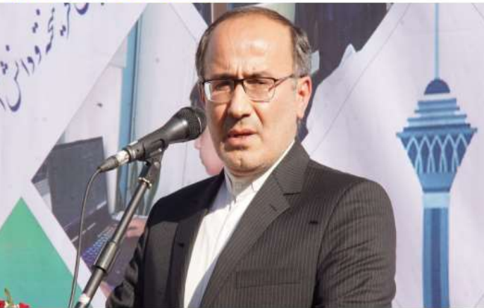
نماینده بابل در انتقاد به وضعیت پسماند: دفع غیر بهداشتی زباله در مازندران، سلامت مردم را با خطر جدی مواجه کرده است