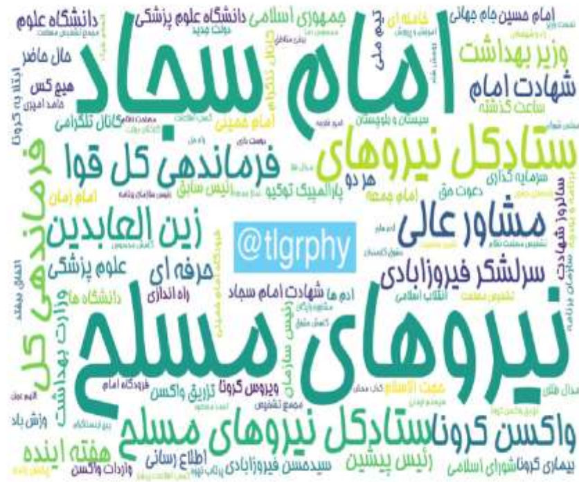
ابروازه مطالب کانال‌های فارسی تلگرام در ۲۴ ساعت گذشته (برحسب مجموع بازدید)