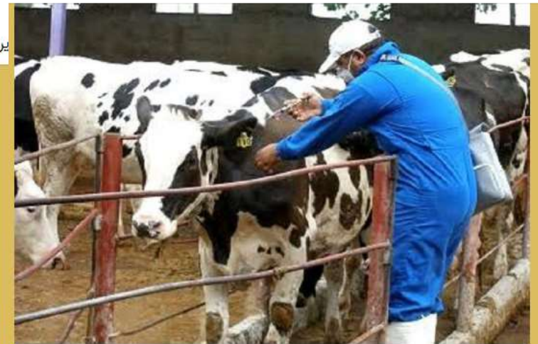
آغاز واکسیناسیون تب برفکی دام از اول پاییز

← کانال خبر فوری ساری ۴۴,۶۸۳ subscribers