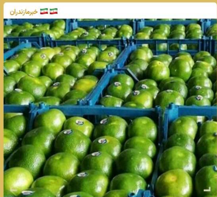
#نارنگی‌های موجود در بازار رنگ‌آوری شده و مضر است