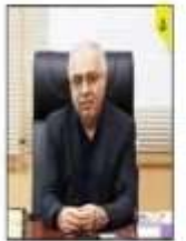
اکبر، مدیر منطق شرکت گاز گیلان ییش از ۴ هزار کیلو متر از خطوط گاز در گیلان نشت یابی شد