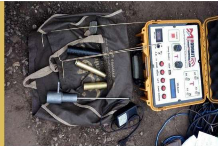
دستگیری ۱۳ حفار غیرمجاز در ساری، آمل و سوادکوه

کانال اطلاع‌رسانی بابل 16,071 subscribers