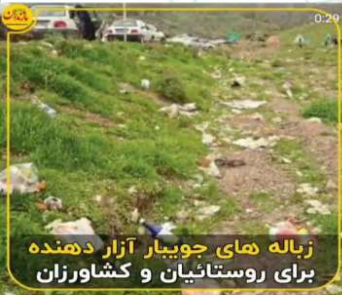
زباله های جویبار آزار دهنده برای روستائیان و کشاورزان

252 views akhbare_maazandaran . زباله های جویبار، آزار دهنده برای روستائیان و کشاورزان زباله های جویبار سالها است در فاصله دو کیلومتری با مرکز شهر دیو می شوند و بوی تعفن آن برای روستائیان و کشاورزان نگران کننده است روزانه ۲۵ تن زباله در شهر جویبار تولید می‌شود/باشگاه خبرنگاران #مازندران #ساری #جویبار #زباله #کشاورز #روستا @akhbare_maazandaran خبرهای سیاسی را در پیج خبرنگار ایران دنبال کنید