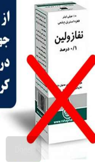
روابط عمومی و امور بین‌الملل دانشگاه علوم پزشکی بابل

از قطره نفازولین جهت پیشگیری و درمان بیماری کرونا استفاده نکنید