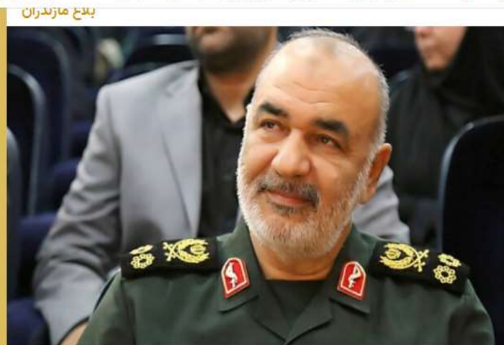
سلامی: واکسن نورا در مرحله بالینی موفقیت‌آمیز بود

Pinned message Photo, انگار بیروز مدافع سلامت امروز/ایثار و فداکاری با دلی پر از ایمان