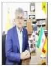
مقدم بنگار به سرپرست شرکت گاز مازندران خبر داد خسارت ۲۴ میلیاردی سیل به شبکه گازرسانی مازندران

سپاهی که پیش می‌آید این است که چرا خلیفه به امام حسین (ع) این همه عزت داد که در پاسخ گفته می‌شود: دلیل اینکه خلیفه متعال عزت حضرت (ع) را نشان می‌دهد این است که حسین (ع) عزت خدا را در حضور انسان داد و اگر او را فراموش کنیم، خود و عزت خود را فراموش خواهیم کرد پس امروز بنگار به حسین (ع) را به عنوان یک برچسب و فرشته کبوتر برایش از هر زبان دیگری به او نثار داریم تا افسانگی ایشان را فراموش نکنیم و از بلاها نجات یابیم.