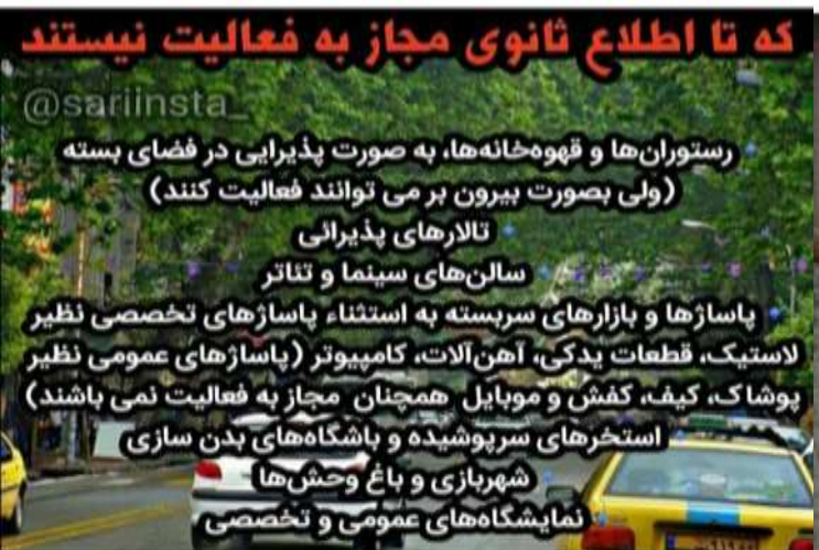
که تا اطلاع ثانوی مجاز به فعالیت نیستند @sariinsta_ رستوران‌ها و قهوه‌خانه‌ها، به صورت پذیرایی در فضای بسته (ولی بصورت بیرون بر می توانند فعالیت کنند) تالارهای پذیرایی سالن‌های سینما و تئاتر پاساژها و بازارهای سرپوشیده به استثناء پاساژهای تخصصی نظیر لاستیک، قطعات یدکی، آهن‌آلات، کامپیوتر (پاساژهای عمومی نظیر پوشاک، کیف، کفش و موبایل همچنان مجاز به فعالیت نمی باشند) استخرهای سرپوشیده و باشگاه‌های بدن سازی شهرسازی و باغ وحش‌ها نمایشگاه‌های عمومی و تخصصی

252 views akhbare_maazandaran . زباله های جویبار، آزار دهنده برای روستائیان و کشاورزان زباله های جویبار سالها است در فاصله دو کیلومتری با مرکز شهر دیو می شوند و بوی تعفن آن برای روستائیان و کشاورزان نگران کننده است روزانه ۲۵ تن زباله در شهر جویبار تولید می‌شود/باشگاه خبرنگاران #مازندران #ساری #جویبار #زباله #کشاورز #روستا @akhbare_maazandaran خبرهای سیاسی را در پیج خبرنگار ایران دنبال کنید