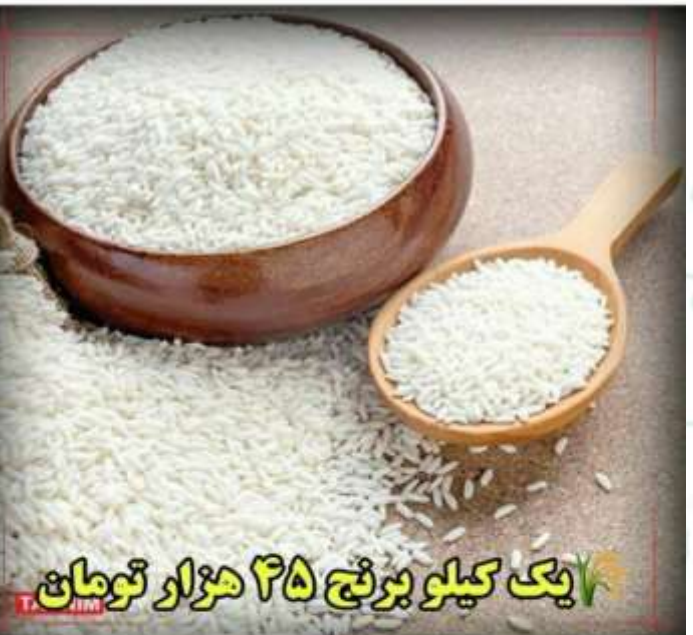
یک کیلو برنج ۴۵ هزار تومان

728 likes sariinsta_ . اتاق اصناف: به جز ۷ شغل فعالیت سایر مشاغل با رعایت پروتکل‌های بهداشتی بلامانع است لیست ۷ گروه مشاغل پر خطر که تا اطلاع ثانوی مجاز به فعالیت نیستند عبارتند از: رستوران‌ها و قهوه‌خانه‌ها، به صورت پذیرایی در فضای بسته (ولی بصورت بیرون بر می توانند فعالیت کنند) تالارهای پذیرایی سالن‌های سینما و تئاتر پاساژها و بازارهای سرپوشیده به استثناء پاساژهای تخصصی نظیر لاستیک، قطعات یدکی، آهن‌آلات، کامپیوتر (پاساژهای عمومی نظیر پوشاک، کیف، کفش و موبایل همچنان مجاز به فعالیت نمی باشند) استخرهای سرپوشیده و باشگاه‌های بدن سازی شهرسازی و باغ وحش‌ها نمایشگاه‌های عمومی و تخصصی