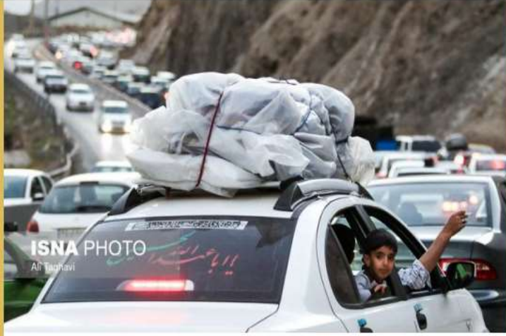
ISNA PHOTO Ali Taghavi

← آخرین خبر مازندران ۳۱۰,۹۳۸ subscribers