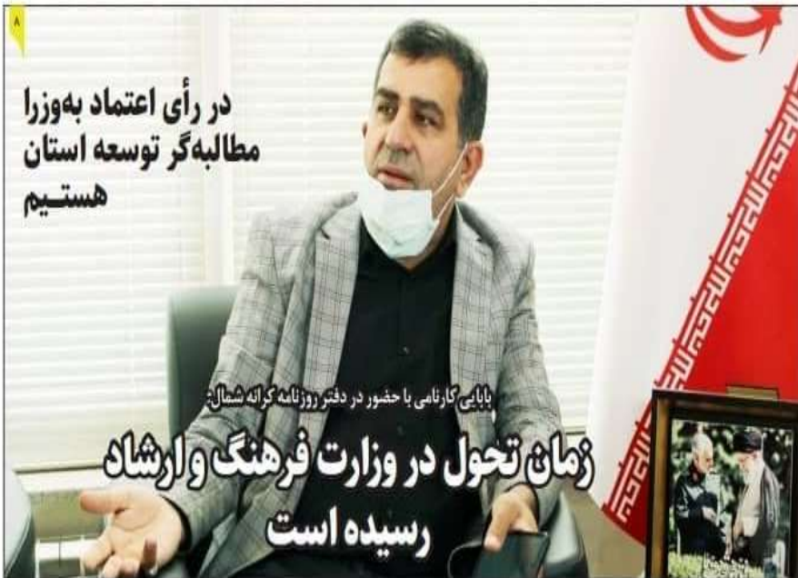
بابایی کارنامی با حضور در دفتر روزنامه کهرانه شمال:

لزوم اجرای مصوبات جدید ستاد مقابله با کرونا در مازندران