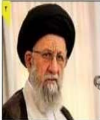
آیت الله نورمحمدی:

مسئله مازندران چهره استان تهران را می‌کشد و مسئولان مازندران نتوانستند آنچنان که شایسته است حل این استان را بگیرند. مسئله نداشتن مدیریت یکپارچه در موضوع کرونا به ویژه در خصوص ورود و خروج در محورهای بومالاسی، مشکلات فرایشی را ایجاد کرده و ما به این موضوع معترض هستیم.