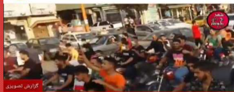
گزارش تصویری «حسن یزدانی» در میان استقبال پرشور مردمی که پروتکل‌های بهداشتی را آنگونه که باید رعایت نکردند، وارد «جویبار» شد

اصناف، ادارات، بانک‌ها به جز اصناف ضروری (مشاغل گروه ۱) تعطیل هستند