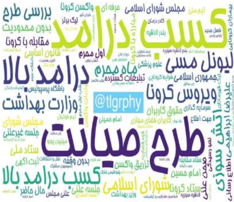
ابرواژه مطالب کانال‌های فارسی تلگرام در ۲۴ ساعت گذشته (برحسب تعداد مطالب)