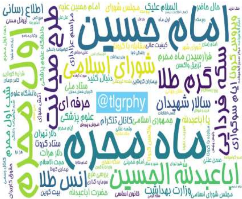
ابرواژه مطالب کانال‌های فارسی تلگرام در ۲۴ ساعت گذشته (برحسب مجموع بازدید)