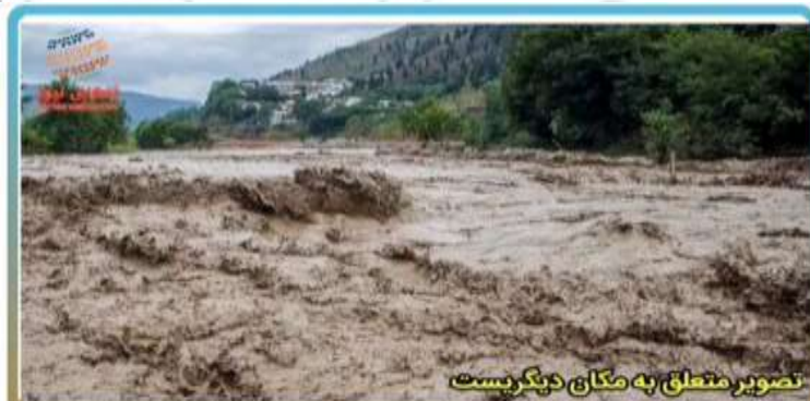
تصویر متعلق به مکان دیگر نیست