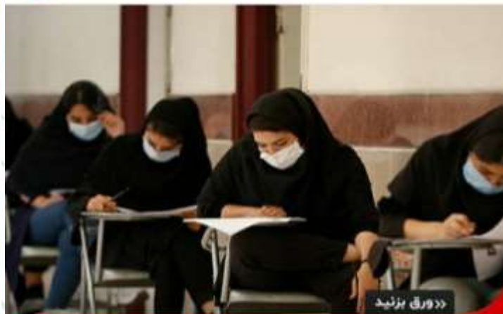
»» ورق بزنید