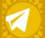
ابرواژه مطالب کانال‌های فارسی تلگرام در ۲۴ ساعت گذشته (برحسب مجموع بازدید)