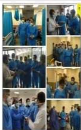
بازدید سرزده رئیس دانشگاه علوم پزشکی مازندران از بیمارستان امام خمینی (ره) آمل

آیت الله خاتمی در دیدار متحان شورای شهر ریاست مازندران روزخانه‌های زرجوب و گوهررود اولویت شورای شهر ریاست باشد ۲ صفحه معاونان مرآت فرهنگ، گردشگری و صنایع مازندران دو ایستگاه قطار گلستان هم جهانی شدند ۳ صفحه معاونت مسکن مازندران ۱۰۰ میلیارد ریال برای بیماری‌روستاهای تاریخی گلستان اختصاص یافت ۳ صفحه