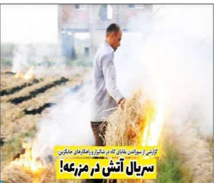
گزارشی از سوزاندن بقایای کاه در شالیزار و راهکارهای جایگزین: سریال آتش در مزرعه!