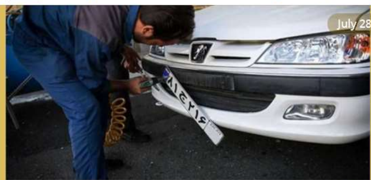
بازگشایی مراکز شماره گذاری خودرو طی روزهای آینده