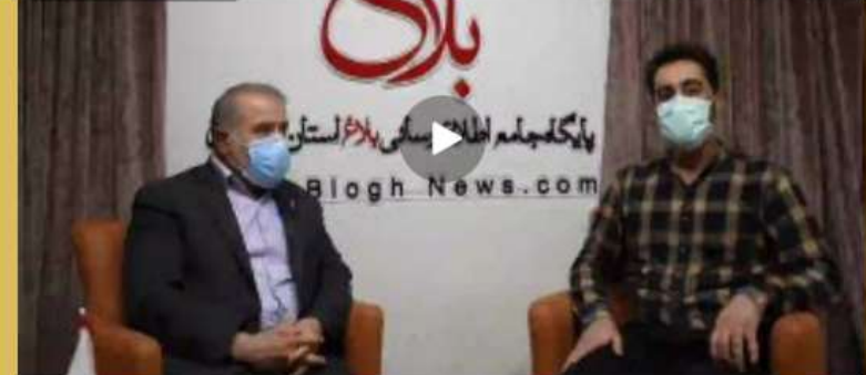
▲ قسمت اول |