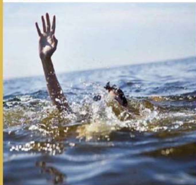
"غرق شدن ۳۱ نفر تیرماه امسال در دریای مازندران"