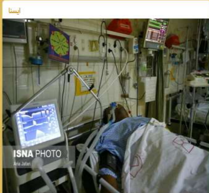
سفرها و فاجعه کرونایی در مازندران / خطری جدید به نام «لامبدا»

دبیر کمیته علمی کشوری کووید ۱۹: ♦ همچنان بر روی بازوی صعودی بیماری در کشور قرار داریم و هنوز به قله پیک پنجم نرسیده ایم. ♦ جهش با عنوان لامبدا به عنوان موتاسیونی جدید در کرونا اتفاق افتاده و هم سرایت‌پذیری و احتمالاً هم قدرت بیماری‌زایی ویروس اثر بگذارد. ♦ هنوز در ایران آن را شناسایی نکردیم. ♦ ما فکر می‌کردیم که تعطیلی‌ها نقطه امید می‌شود، اما اکنون می‌بینیم که در استان گلستان و مازندران فاجعه شده است.