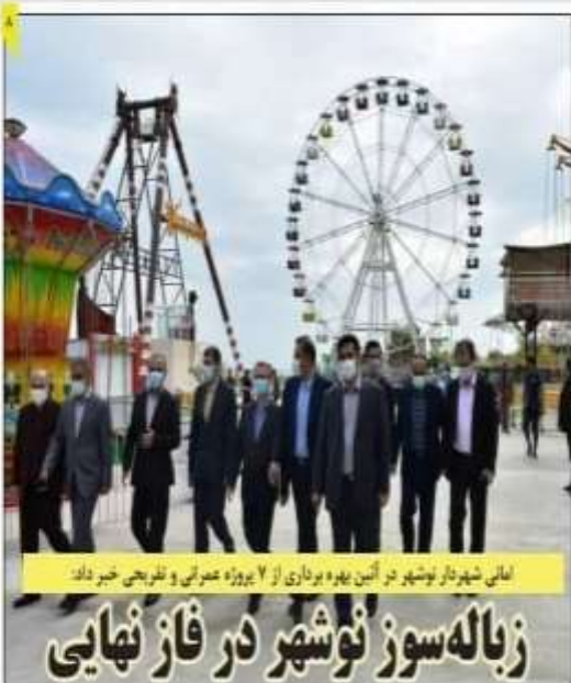
امامی شهردار نوشهر در آیین بهره‌برداری از ۷ پروژه عمرانی و تفریحی خبر داد

در چندین نمونه از اشتباهات عجیب در برگزاری الپیک توکیو در کشور مظهر و ملحق ژاپن که امروز توسط ایران با جهان امروز یک کشور توسعه یافته باس که شاهد پدیده‌های نامتعارف مسابقات است که در حالی شایک شده که بازرگانی از مسابقات را تصدیق کرده چنانچه جدید یک سوم شرکتگران نمی‌توانست شرکت کنند در حالی که همه چینی از مسابقات استناد کرده بودند