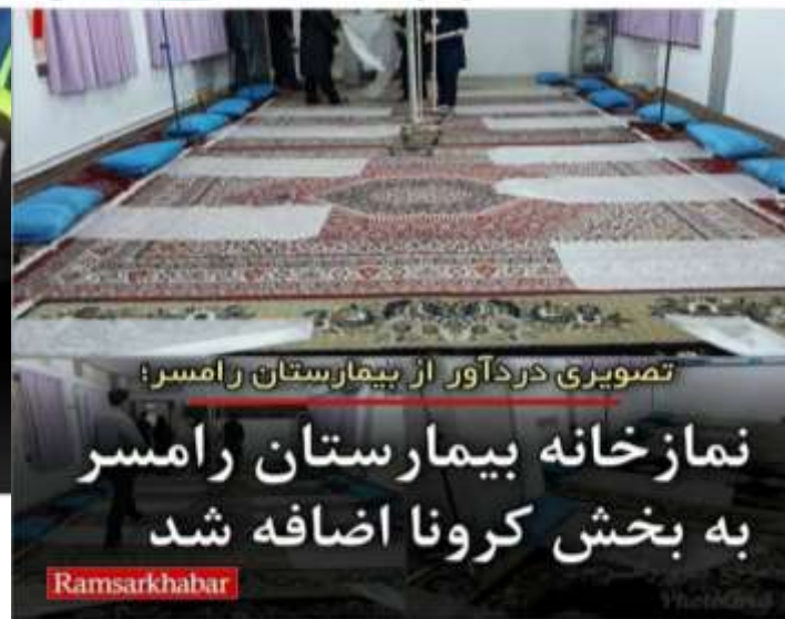
تصویری دردآور از بیمارستان رامسر؛

عضو شورای قضایی استان افزود: علائم مسمومیت با گاز مونوکسید کربن سردرد، سرگیجه، تهوع، ضعف عمومی و شبیه سرماخوردگی، تاری دید، تنگی نفس بوده و اگر اقدامی صورت نگیرد، کاهش هوشیاری و مرگ را در پی خواهد داشت.