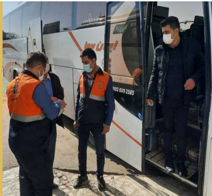
اجرای طرح کنترل و نظارت بر وسایل نقلیه عمومی در جاده‌های مازندران