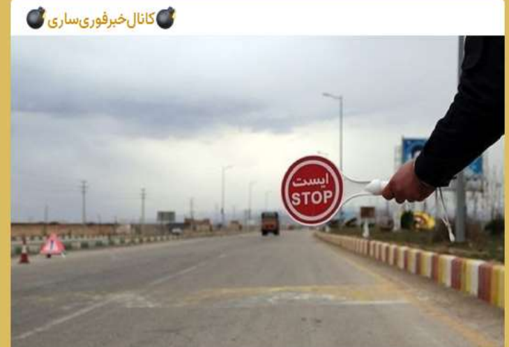
ورود به مازندران ممنوع!

T.me/joinchat/AAAAAEB5-OtpzOuu_gMURA 4807 ۱۳:۴۲ پ.ظ