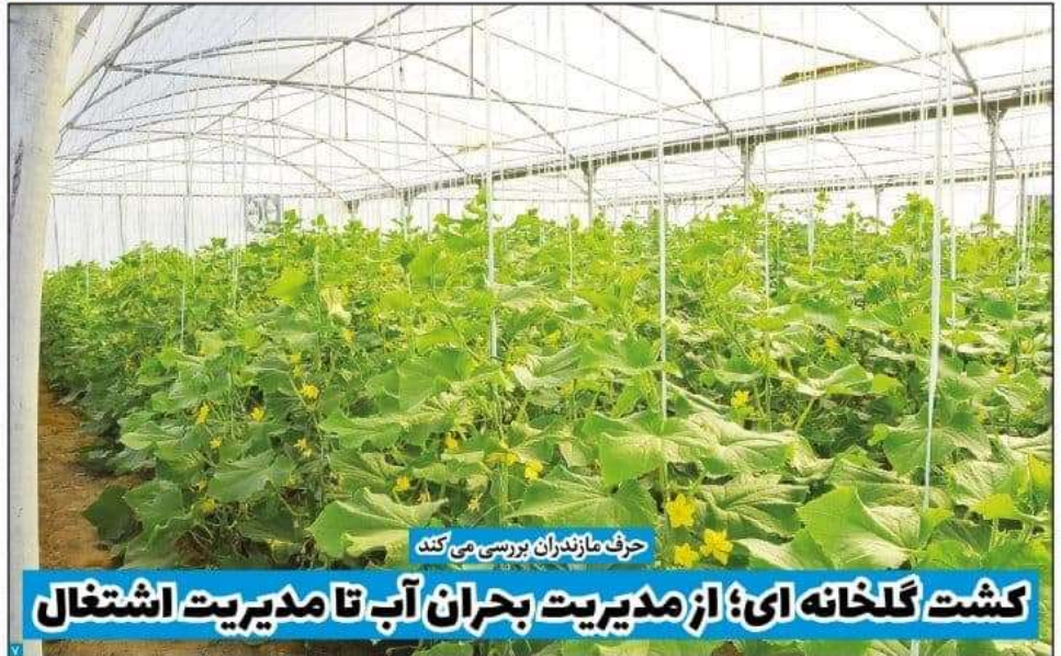
حرف‌مازندران بررسی می‌کند

کشت گلخانه‌ای؛ از مدیریت بحران آب تا مدیریت اشتغال