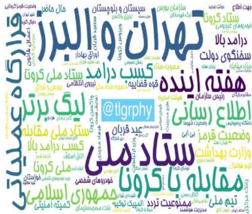
ابرواژه مطالب کانال‌های فارسی تلگرام در ۲۴ ساعت گذشته (برحسب تعداد مطالب)