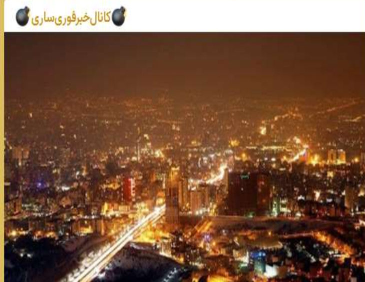
عبور مجدد مصرف برق مازندران از سهمیه روزانه

♦ سرپرست شرکت توزیع برق مازندران با اشاره به افزایش مصرف برق، گفت: روز گذشته باید حدود یک‌هزار و ۵۰۰ مگاوات مصرفی داشتیم اما میزان سهمیه اختصاص داده شده به ما ۴۰۰ مگاوات افزایش یافت و از سهمیه اختصاص داده به استان عبور کردیم.