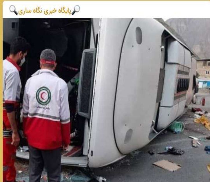
جزئیات واژگونی اتوبوس در محور هراز

مدیرکل دفتر آمار، ایمنی و ترافیک سازمان راهداری و حمل‌ونقل جاده‌ای : ♦ علت تصادف اتوبوس مسافری در محور هراز ، توجه نکردن راننده به جلو و توانایی نداشتن در کنترل وسیله نقلیه ناشی از خستگی و خواب‌آلودگی او بوده که در این زمینه راننده مادام‌العمر ممنوع الخدمات خواهد شد و با شرکت حمل و نقل مورد نظر به دلیل تخلفات متعدد در این سفر برخورد جدی خواهد شد.