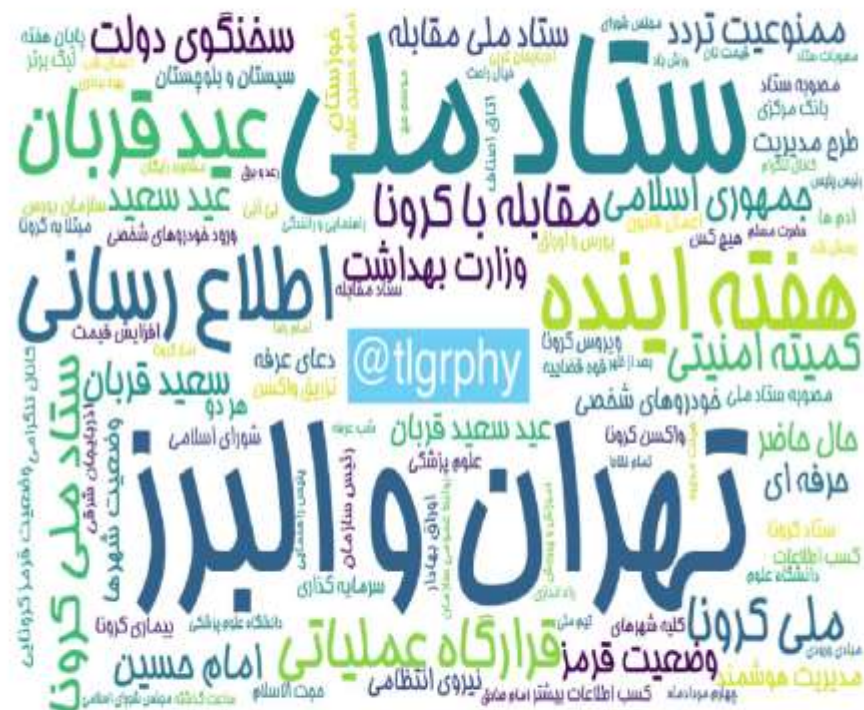
ابرواژه مطالب کانال‌های فارسی تلگرام در ۲۴ ساعت گذشته (برحسب مجموع بازدید)