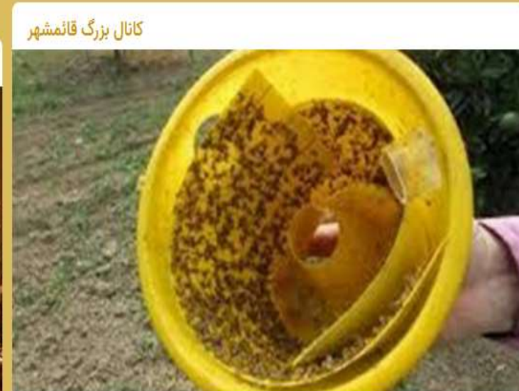
▲ افزایش جمعیت آفت مگس میوه در باغ‌های مازندران