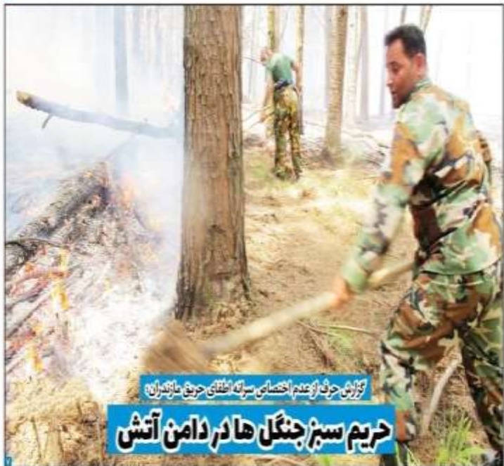
گزارش حرف از عدم اختصاصی سرانه اطفای حریق مازندران؛ حریم سبز جنگل‌ها در دامن آتش

موج پنجم کرونا تمام بخش‌های بیمارستانی مازندران را اشغال کرد