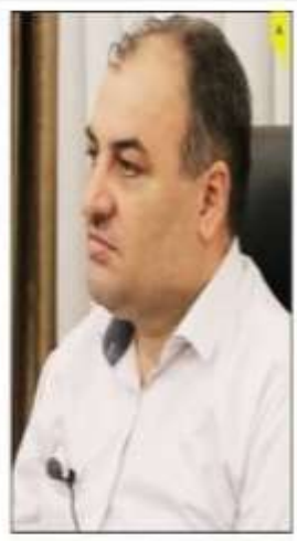
مخبره‌های شهرداری تنکابن در نشست خبری: پرونده املاک پروژه مصلی سرانجام محتومه اعلام شد