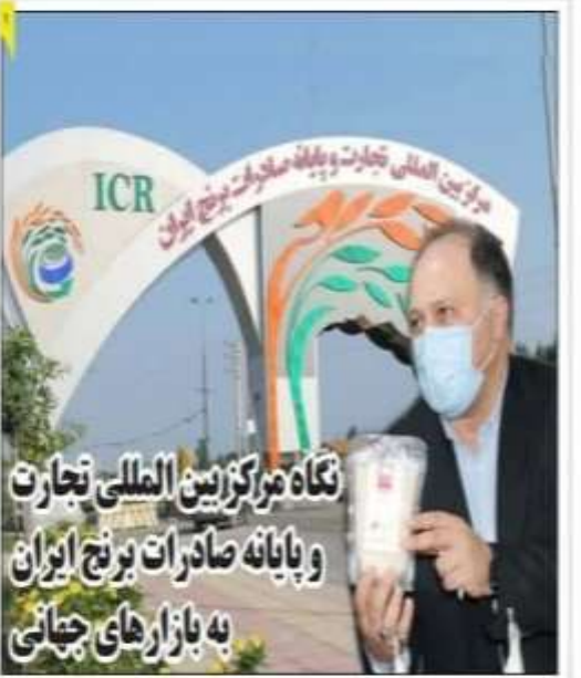
نگاه مرکز بین‌المللی تجارت و پایانه صادرات برنج ایران به بازارهای جهانی