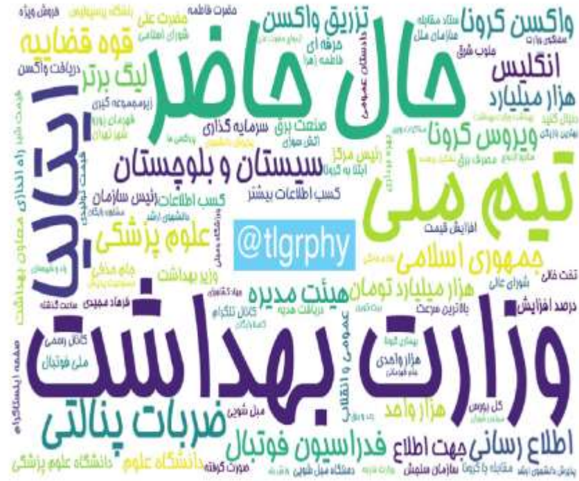
ابرواژه مطالب کانال‌های فارسی تلگرام در ۲۴ ساعت گذشته (برحسب مجموع بازدید)