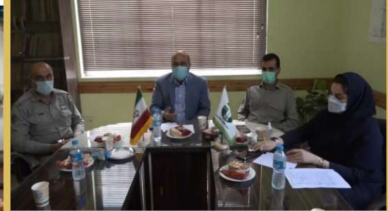
افراد مشکوک در آتش‌سوزی میانکاله تحت تعقیب قضایی

Photo, آرامش شب چه بسیار دلها که غمگین و پر اضطرابند. خدایا تو آرام دلشا