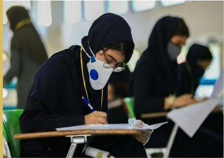
لغو آزمون مدارس نمونه دولتی در مازندران

اخبار آمل و نور اخبار آمل و نور Photo, مدیرکل سلامت آم