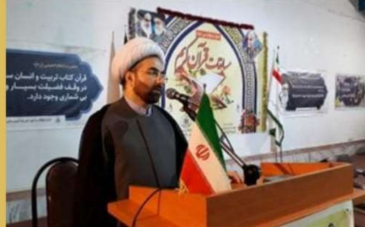
آغاز مسابقات قرآن کریم در مازندران

◆ رئیس اداره امور قرآنی اداره کل اوقاف و امور خیریه مازندران: مسابقات منطقه‌ای قرآن کریم اوقاف مازندران آغاز شد.