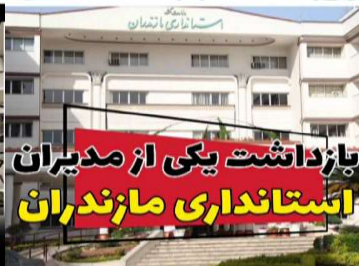
بازداشت یکی از مدیران استانداردی مازندران