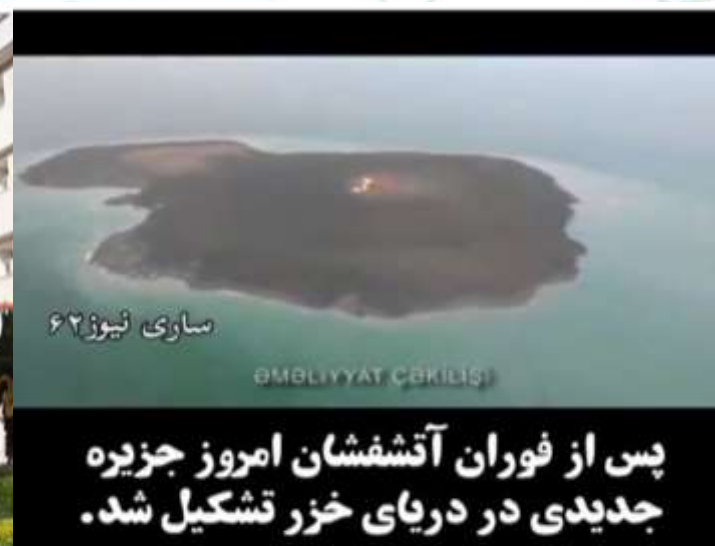
ساری نیوز ۶۲ پس از فوران آتشفشان امروز جزیره جدیدی در دریای خزر تشکیل شد.

در راستای مبارزه با مفاسد اقتصادی یکی از مدیران اقتصادی استانداردی مازندران بازداشت شد. م.گ، از سال ۹۵ در این مسئولیت حضور داشت که با حکم قضایی از سوی سربازان گمنام امام زمان (عج) بازداشت شد. پیش از این در برخی از محافل نسبت به برخورد قضایی با برخی مدیران متخلف دولت، پس از پایان دوره مسئولیتشان سخن گفته می‌شد، اما به نظر می‌رسد اراده موجود در مبارزه با مفاسد اقتصادی منتظر پایان مسئولیت این مدیران نمانده است. از سویی برخی منابع احتمال می‌دهند این روند تا بازداشت چند مدیر دیگر ادامه داشته باشد/موفق