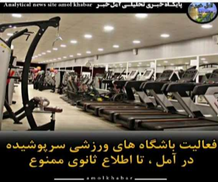
فعالیت باشگاه‌های ورزشی سرپوشیده در آمل، تا اطلاع ثانوی ممنوع