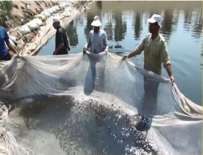
بازسازی ذخایر ژنتیکی ماهیان خزر

♦ شیلات مازندران برای ترمیم ذخایر ژنتیکی بزرگترین دریاچه جهان اقدام به رهاسازی بیش از ۷۲ میلیون بچه ماهی در رودخانه های شیلاتی کرد.