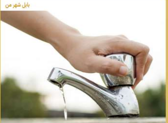
کاهش ۵۰ تا ۶۰ درصدی آب رودخانه‌های مازندران

Pinned message مدیر فروش، مدیر آموزش «آرامش شما هدف ماست» موفقیت اتفاقی نیست»