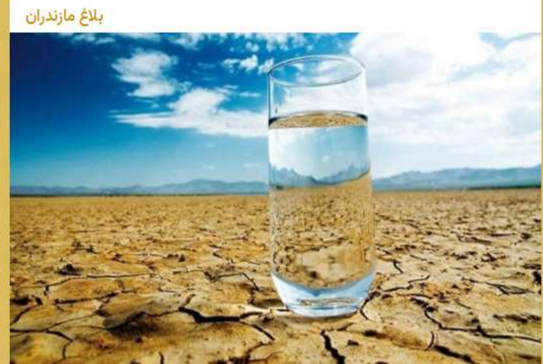
▲ عطش بی‌آبی روستاهای میانرود را گرفتار کرده است؛

● بحران کم‌آبی سورک روی خط قرمز/مردم از قطعی مکرر آب کلافه شدند