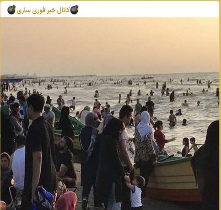
تمامی طرح‌های سالم‌سازی دریا در استان مازندران تا اطلاع ثانوی تعطیل شد

همچنین تمامی ورودی‌ها به سواحل مسدود خواهد شد اما در عین حال منجیان غریق جهت جلوگیری از شنای مسافران و پیشگیری از غرق شدن در نوار ساحلی مستقر خواهند بود.