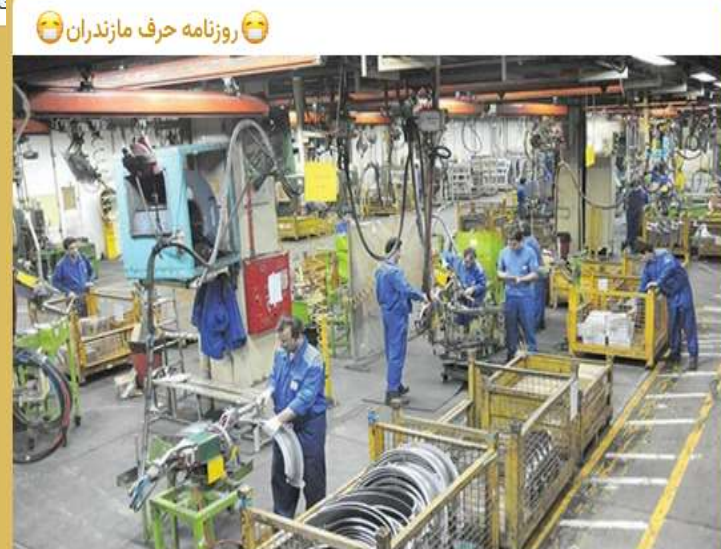
بازگشت ۷۰ واحد راکد مازندران به چرخه تولید