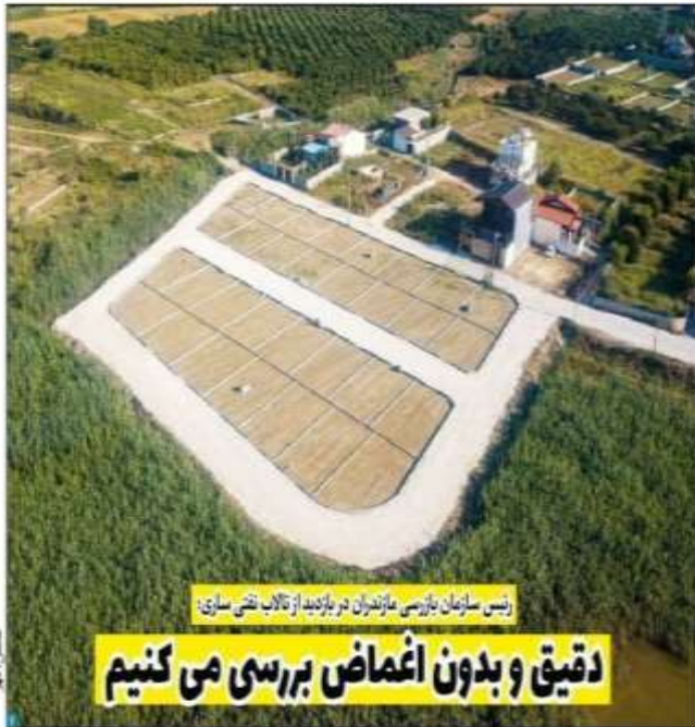
رئیس سازمان بازرسی ندران در بازدید از تالاب نقش سازی: