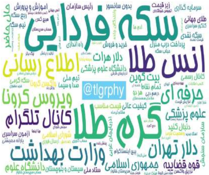
ابرواژه مطالب کانال‌های فارسی تلگرام در ۲۴ ساعت گذشته (بر حسب مجموع بازدید)