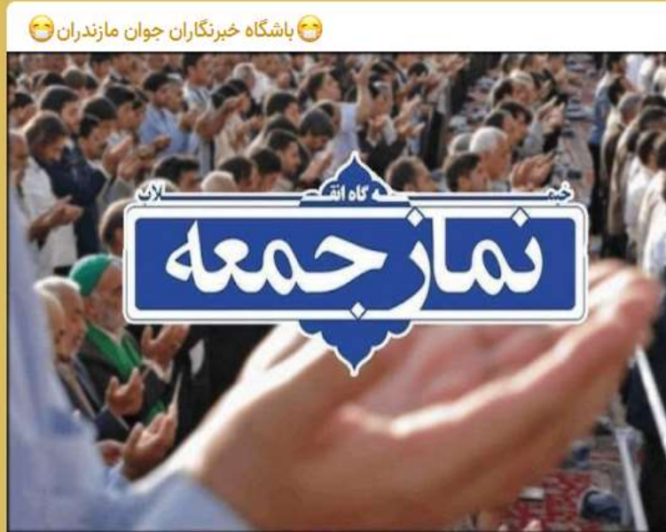
باشگاه خبرنگاران جوان مازندران

Pinned message Photo, این دوره انتخابات شوراهای اسلامی با رقابت ۱۴۸۲ مازندرانی در ۶۲ شهر