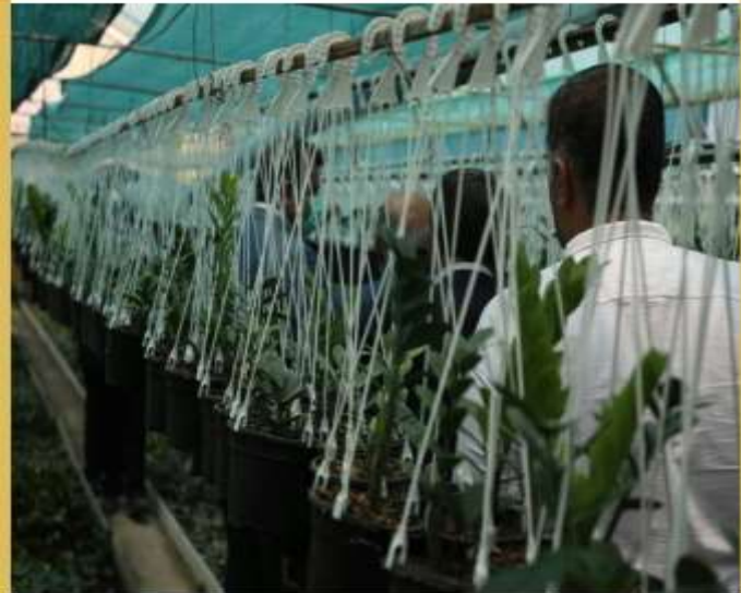
بهره برداری از ۱۴ طرح مختلف در بابل

Pinned message Photo, ان در وضعیت قرمز، ۵ شهرستان در وضعیت نارنجی و ۱۶ شهرستان