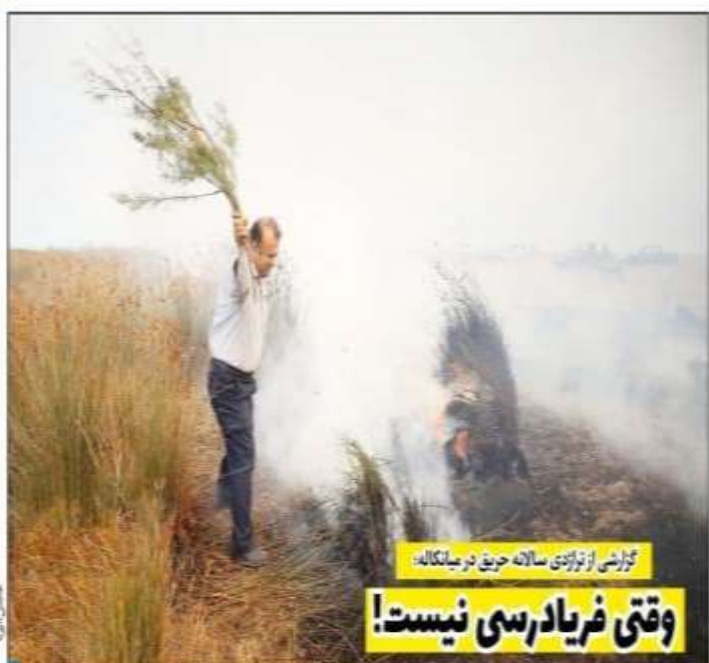
گزارشی از تازیدی سالانه حریق در میانهکاله.