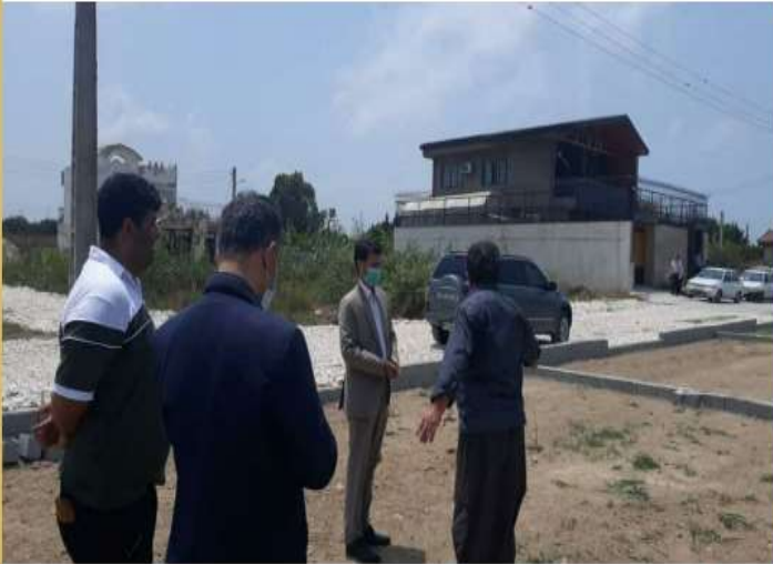
سوداگران تالاب نفت ساری زیر ذره بین بازرسی

مدیرکل بازرسی مازندران در جریان بازدید از این تالاب: