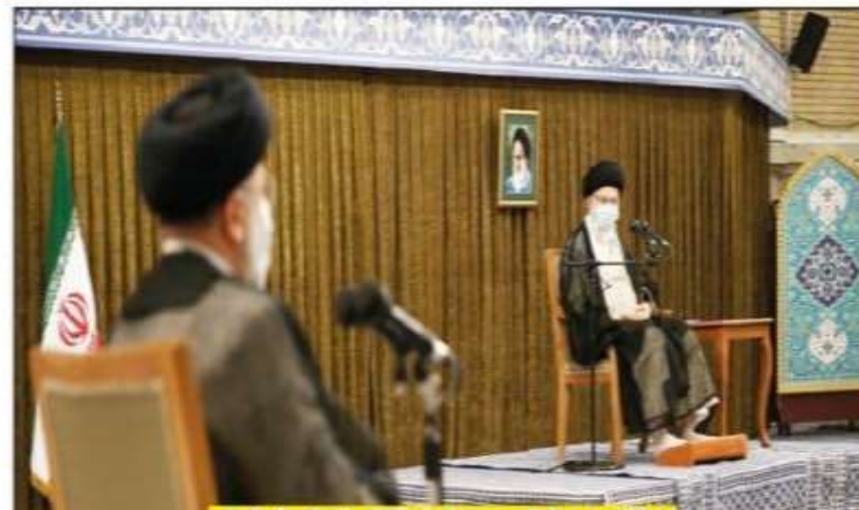
رهبر انقلاب در دیدار رئیس و مسئولان قوه قضائیه با ایشان مطرح کردند.

ضرورت ادامه مسیر اعتمادافزا و امیدبخش دو سال اخیر قوه قضائیه