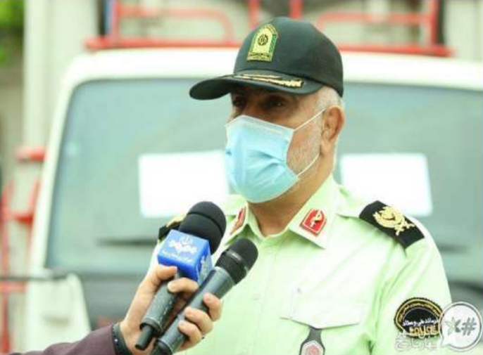
کشف قاچاق ۱۰۰۰ تن نهاده دامی در مازندران