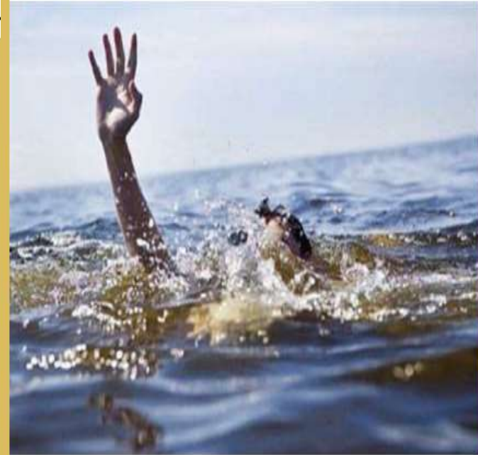
نجات جان ۱۷۱ نفر از غرق شدن در دریای مازندران