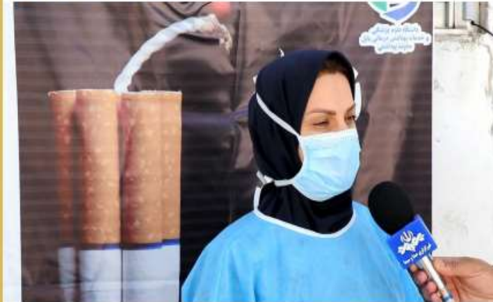
معرفی شهر گتاب به عنوان شهر بدون دخانیات

◆ گتاب از سوی وزارت بهداشت و درمان به عنوان شهر بدون دخانیات استان مازندران معرفی شد.