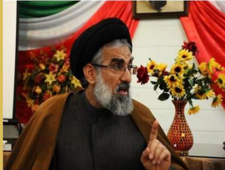
اعلام نتایج انتخابات میان‌دوره‌ای مجلس خبرگان در مازندران

رضایی فرماندار ساری و رییس حوزه برگزاری انتخابات خبرگان در استان: ◆ از کل آراء ماخوذه ۹۱۳ هزار و ۶۲۹ رای، آقای سید صادق پیشنمازی ۵۹۱ هزار و ۲۸۱ رای و محمدحسن گلی شیردار ۳۲۲ هزار و ۳۴۸ رای بدست آوردند ◆ با نتایج اعلامی، آقای سید صادق پیشنمازی به عنوان نماینده مردم مازندران در پنجمین دوره مجلس خبرگان رهبری انتخاب شد.