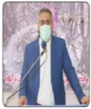
مدیرکل آموزش و پرورش مازندران تأکید کرد: لزوم تهیه زیرساخت در حوزه هنرستان‌ها و کارگاه‌های مدارس فنی و حرفه‌ای

شنبه ۲۹ خردادماه ۱۴۰۰ - آذر القنده ۱۳۲۲ - 19 Jun 2021 شماره ۲۹۹۹ - سال سی ام - تکثیرشماره ۲۰۰۰۰ ریتال