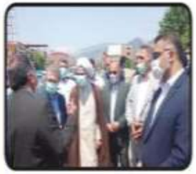
با زنده ماندن وی قفسه در استان مازندران از عملیات تفریح و بسیاری بخش از معمر گذران