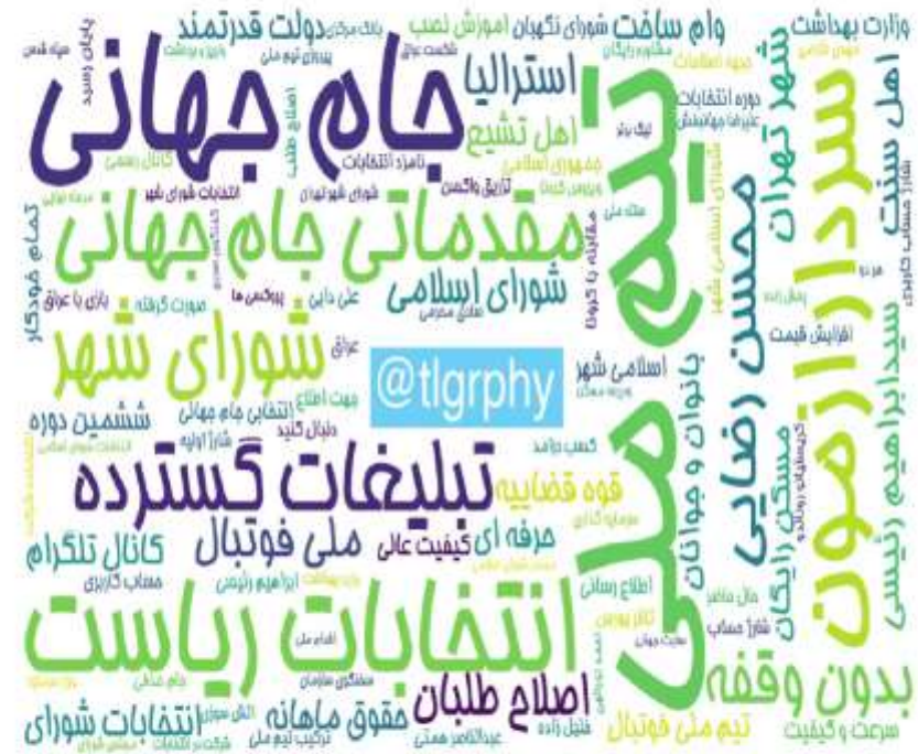
ابرواژه مطالب کانال‌های فارسی تلگرام در ۲۴ ساعت گذشته (برحسب مجموع بازدید)