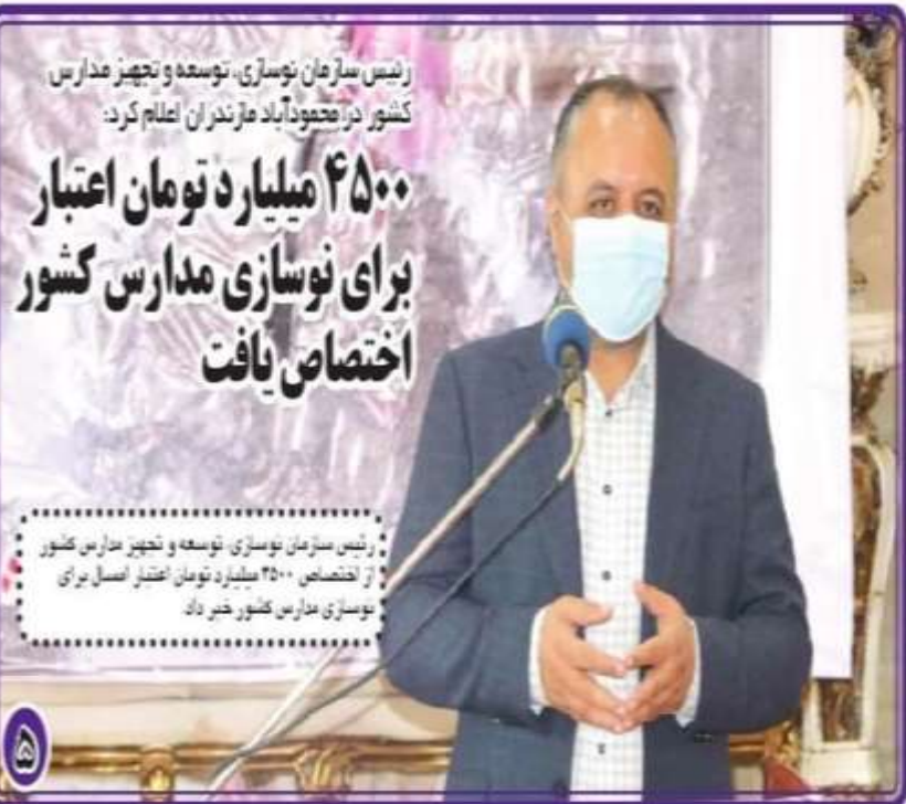
رئیس سازمان نوسازی، توسعه و تجهیز مدارس کشور در ادامه دیدار با مدیران مازندران اعلام کرد: ۴۵۰۰ میلیارد تومان اعتبار برای نوسازی مدارس کشور اختصاص یافت

رئیس سازمان نوسازی، توسعه و تجهیز مدارس کشور از اختصاص ۴۵۰۰ میلیارد تومان اعتبار اصل برای نوسازی مدارس کشور خبر داد