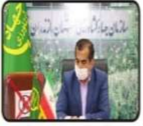
رئیس سازمان جهاد کشاورزی مازندران تأکید کرد: لزوم استفاده از همه ظرفیت‌ها برای خرید گندم و گلزای کشاورزان