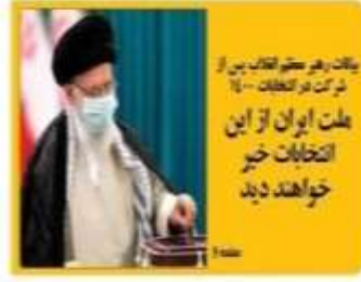
بیانات رهبر معظم انقلاب پس از شرکت در انتخابات - ملت ایران از این انتخابات خیر خواهند دید

سال نوایم هجرت ۱۴۰۰ - خرداد ۱۴۰۰ - شماره ۱۱۱۲ - قفسه ۱۱۱۲ - آدرس: ۲۰۲۱ - مازندران - شماره ۳۱۱۲ - تلفن: ۳۰۰۰ - تهران