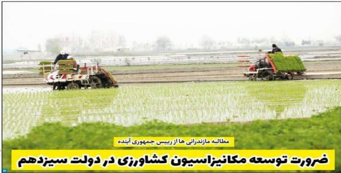
مطالبه مازندرانی‌ها از رییس جمهوری آینده

ضرورت توسعه مکانیزاسیون کشاورزی در دولت سیزدهم