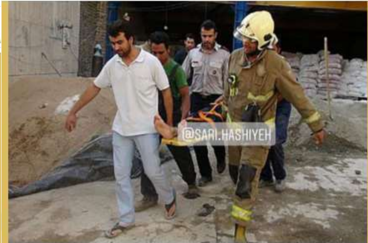
سقوط یک نفر از داربستی دور میدان شهیدان عبوری ساری در هنگام جسیاندن بنر تبلیغاتی که منجر به مرگش شد

Pinned message بی فرجام! / خطر حریق مجدد؛ بیخ گوش مسجد جامع ساری