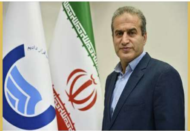
مقابله با #تش‌آبی در مازندران

Pinned message Photo, ۱۴۰۰ خرداد ۱۹ چهارشنبه، شهر بابل انتخابات شورای شهر بابل