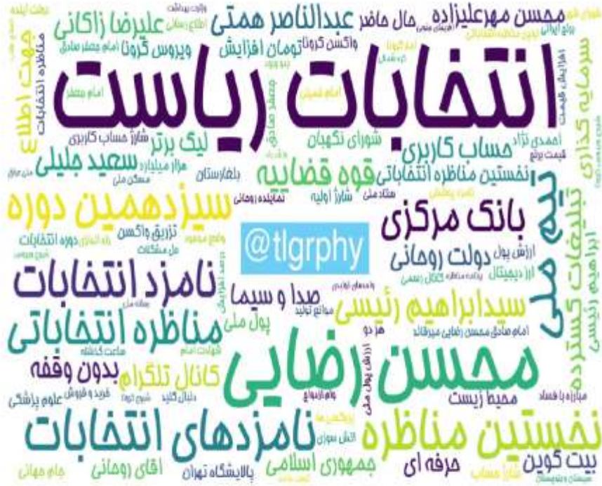
ابرواژه مطالب کانال‌های فارسی تلگرام در ۲۴ ساعت گذشته (برحسب مجموع بازدید)