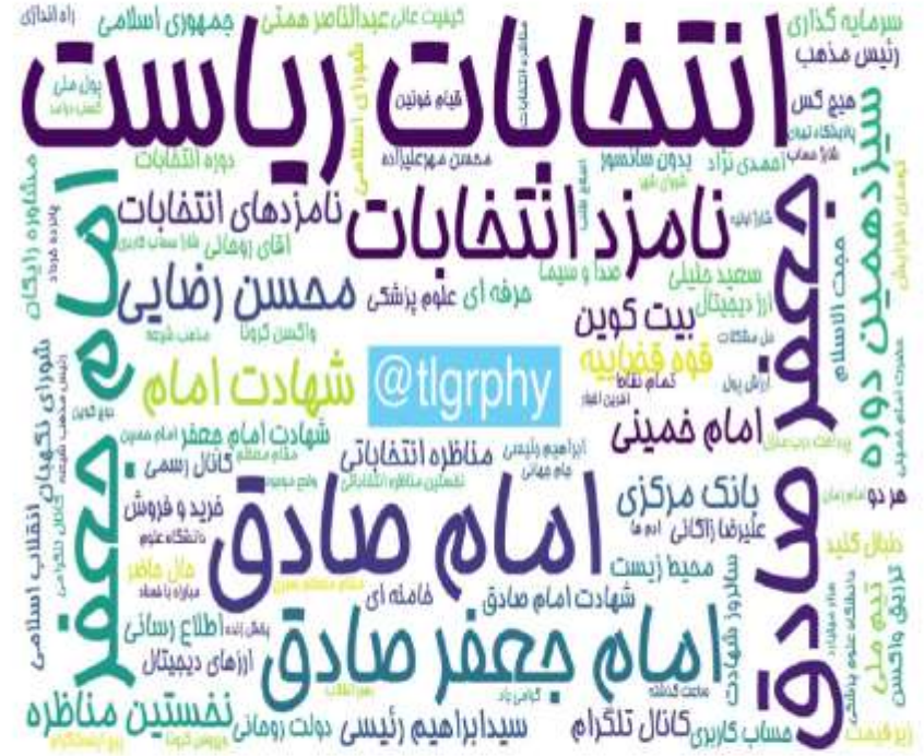
ابرواژه مطالب کانال‌های فارسی تلگرام در ۲۴ ساعت گذشته (برحسب تعداد مطالب)