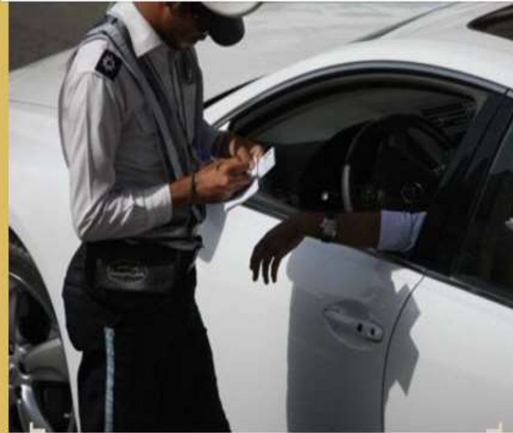
جریمه‌های رانندگی افزایش نمی‌یابد

Pinned message Photo, ندران استعفا دادند؛ نفوذ و لابی برای تایید صلاحیت برخی افراد