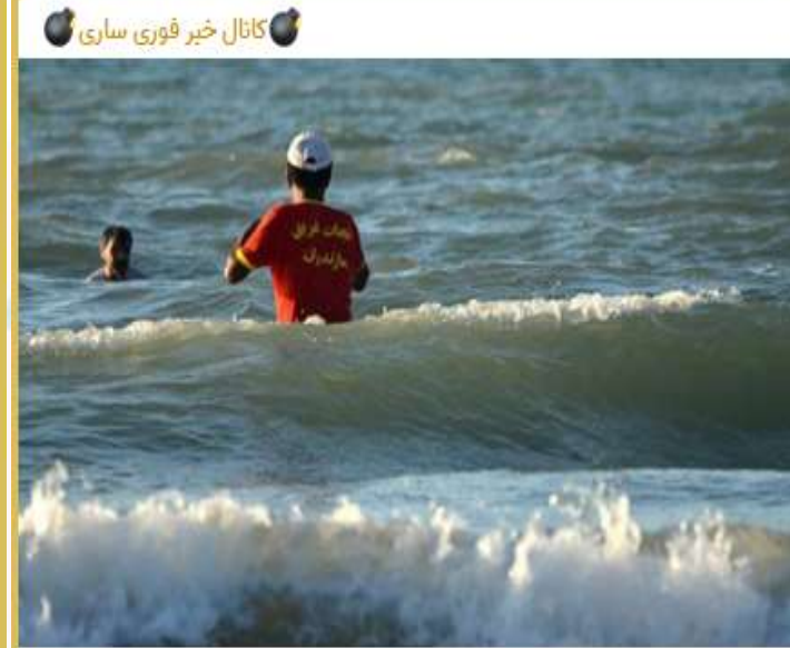
نجات جان ۳۴ نفر از خطر غرق شدن در دریا

Pinned message Photo, محصولات آرایشی، بهداشتی و مراقبتی پوست و مو در مازندران با درآمد utm_medium=copy_link 9347 ۱۰:۱۹ ب.ظ