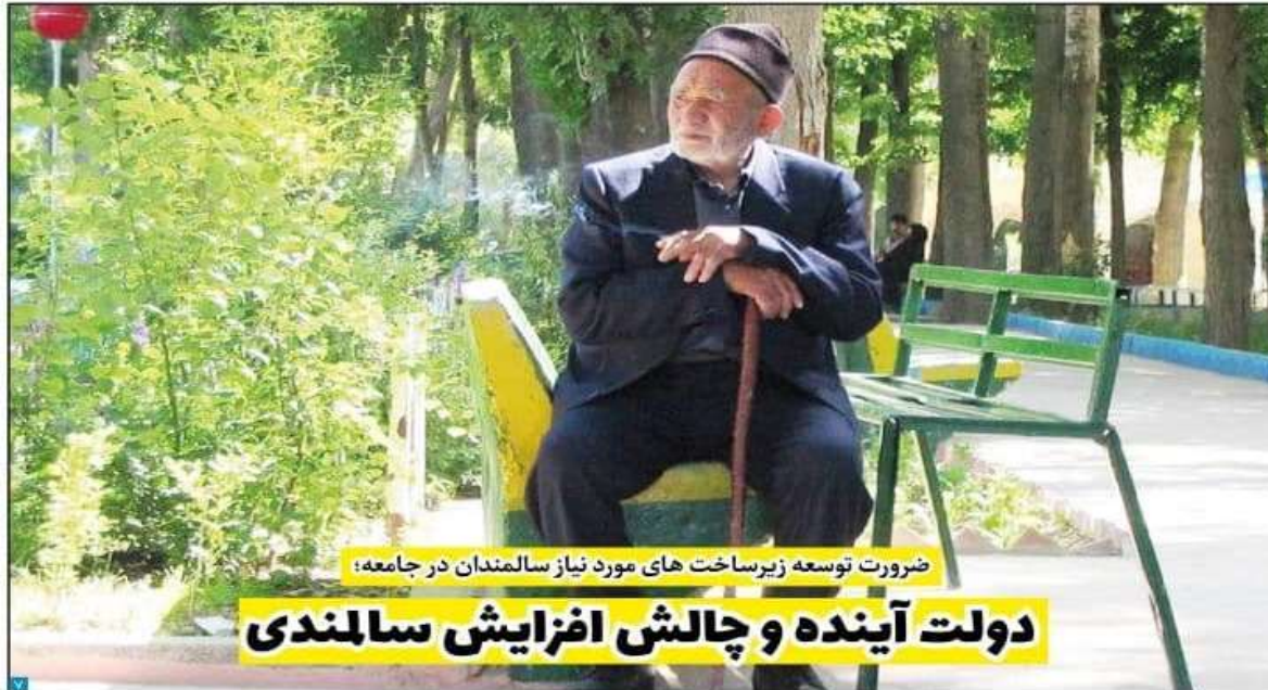
ضرورت توسعه زیرساخت‌های مورد نیاز سالمندان در جامعه؛