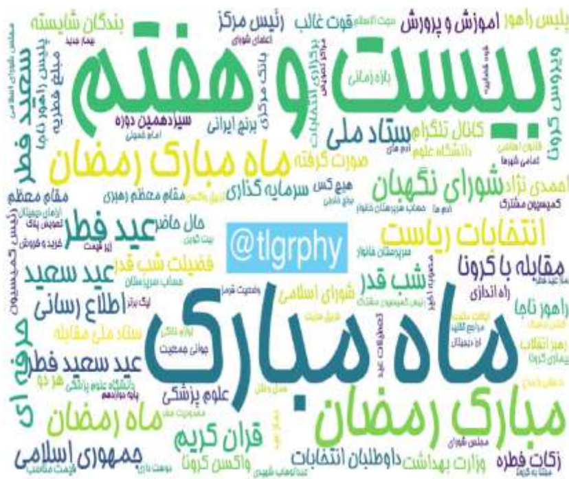
ابرواژه مطالب کانال‌های فارسی تلگرام در ۲۴ ساعت گذشته (برحسب مجموع بازدید)