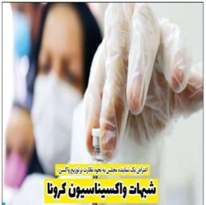
اعتراض یک نماینده مجلس به نحوه نظارت بر توزیع واکسن