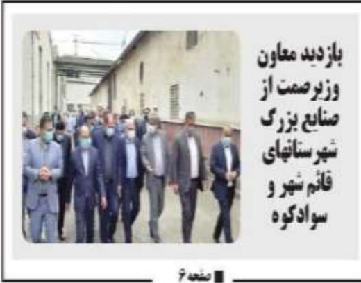
بازدید معاون وزیر صمت از صنایع بزرگ شهرستانهای قائم شهر و سوادکوه

شهادت مظلومانه اولین شهید محراب حضرت امام علی (ع)، بزرگ سرد تاریخ بشیریت و امانه عموم مسلمانان جهان، تسلیت عرض می‌نماییم.