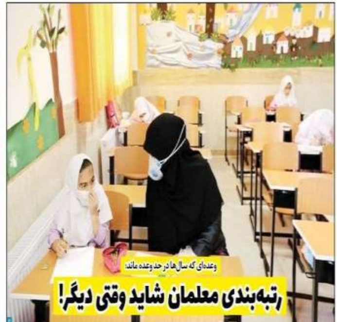
وعدای که سال‌ها در جد وعده ماند؛ رتبه‌بندی معلمان شاید وقتی دیگر!

مدیرکل راهداری و حمل و نقل ۹۲ درصد از جمعیت روستایی مازندران از راه آسفالته برخوردارند