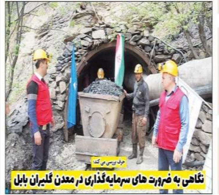
نگاهی به ضرورت‌های سرمایه‌گذاری در معدن گلیران بابل