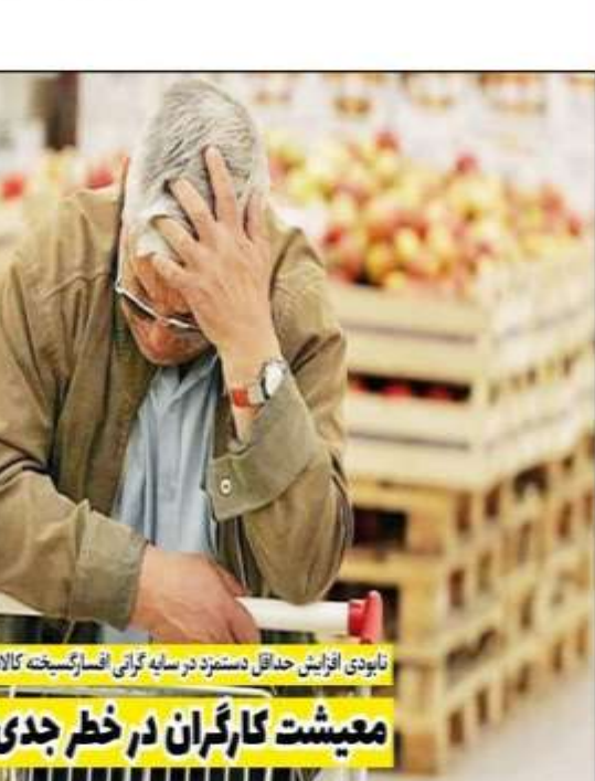
نابودی افزایش حداقل دستمزد در سایه گرانی افسارگسیخته کالاها: معیشت کارگران در خطر جدی!