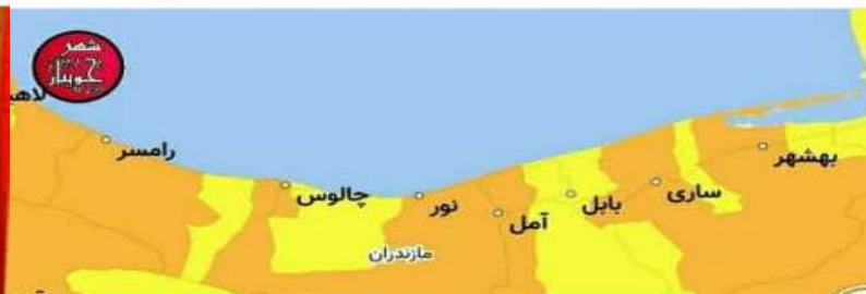
تازه ترین بروزرسانی نرم افزار ماسک ، شهرستان جویبار را همچنان در وضعیت «نارنجی کرونایی»، نشان میدهد