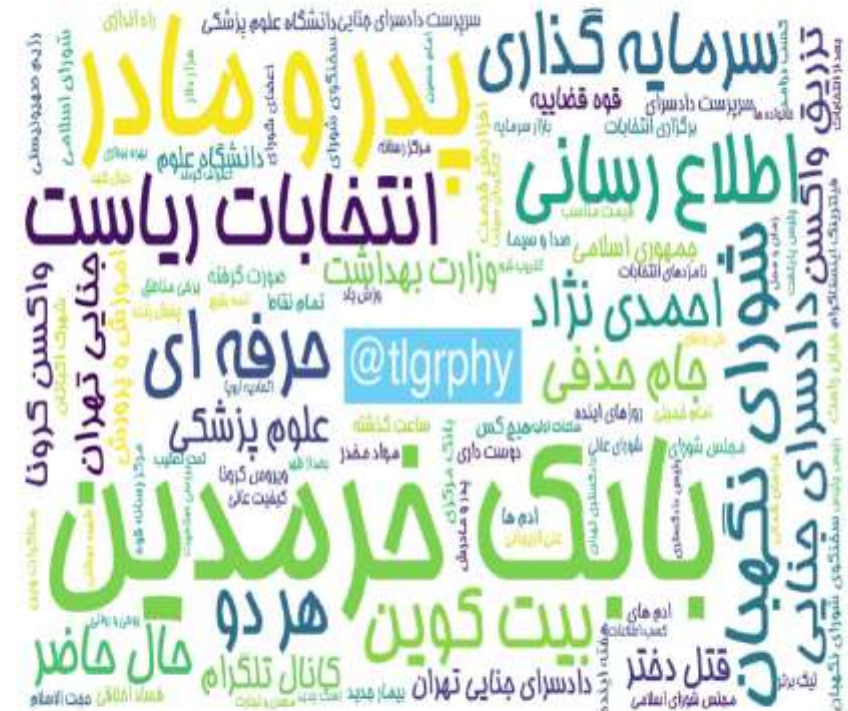
ابرواژه مطالب کانال‌های فارسی تلگرام در ۲۴ ساعت گذشته (برحسب مجموع بازدید)