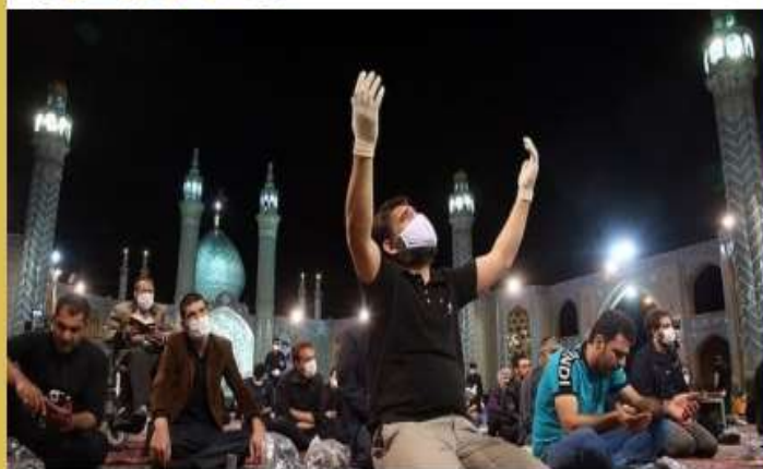
جزئیات برگزاری مراسم شب‌های قدر و نماز عیدفطر از زبان سخنگوی ستاد ملی مقابله با کرونا