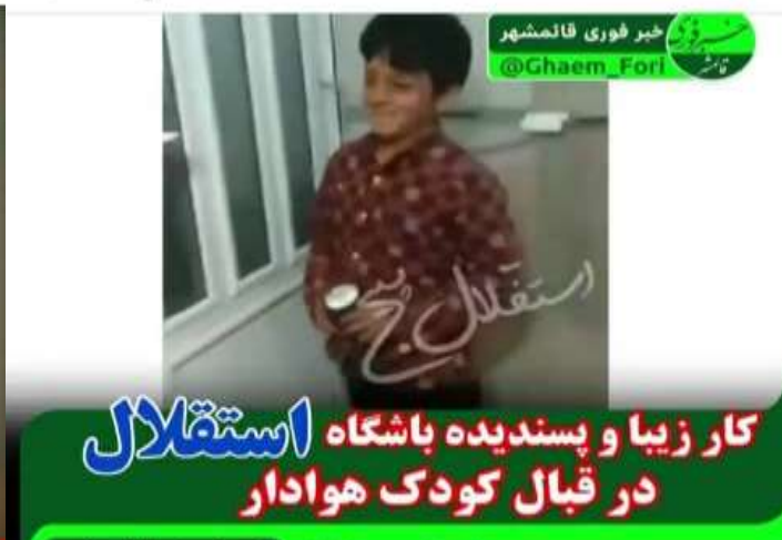
کار زیبا و پسندیده باشگاه استقلال در قبال کودک هوادار