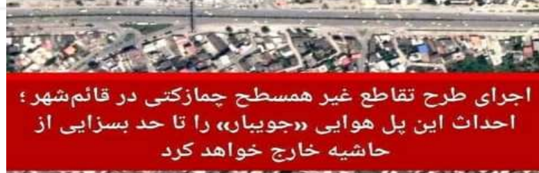
اجرای طرح تقاطع غیر همسطح چمازکتی در قائم‌شهر؛ احداث این پل هوایی «جویبار» را تا حد بسزایی از حاشیه خارج خواهد کرد