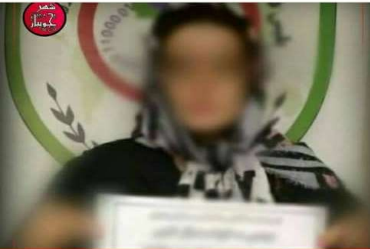
زنی که نسبت به مردم مازندران و دیگر استانهای شمالی کشور فحاشی می‌کرد، دستگیر شد