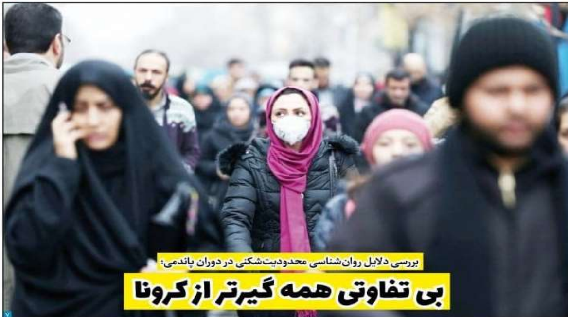
بررسی دلایل روان‌شناسی محدودیت‌شکنی در دوران پاندمی؛