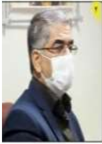
مدیرکل فرهنگ و خصلت بازرگانی استان مآزندان

بازرسی های ویژه پروکل های بهداشتی از خیازی ها تنبیدی می شود