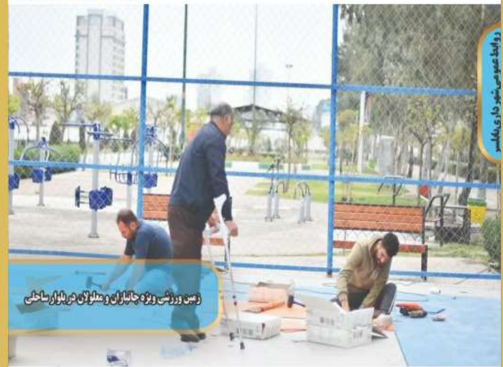
زمین ورزشی ویژه جانبازان و معلولان در بلوار ساحلی

احداث زمین ورزشی ویژه جانبازان و معلولان در بلوار ساحلی #بابلسر