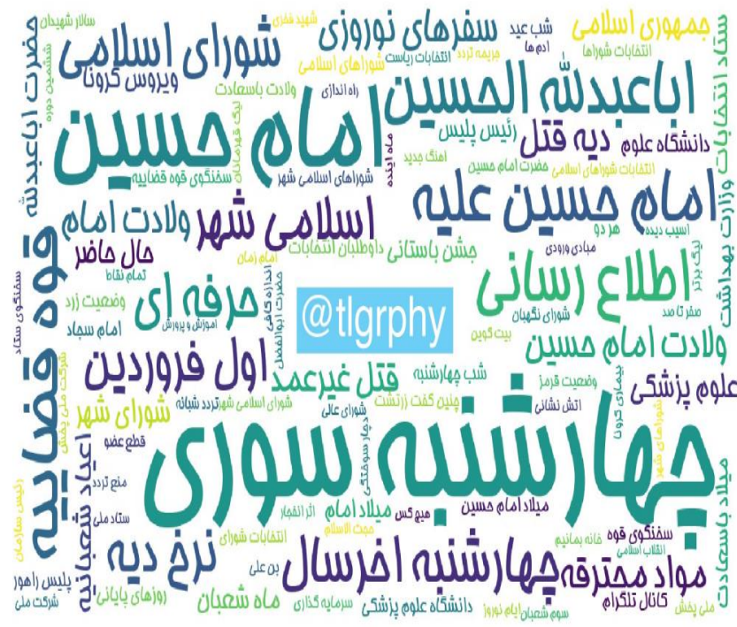
ابرواژه مطالب کانال‌های فارسی تلگرام در ۲۴ ساعت گذشته (برحسب مجموع بازدید)