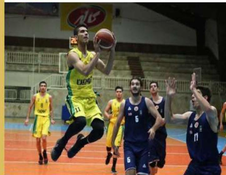
صعود نماینده مازندران به مرحله یک چهارم نهایی لیگ برتر بسکتبال

تیم کوچین آمل با برتری مقابل آویژه صنعت مشهد در بازی سوم به مرحله یک چهارم نهایی لیگ برتر بسکتبال صعود کرد.