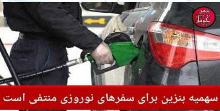
سه‌میه بنزین برای سفرهای نوروزی منتفی است