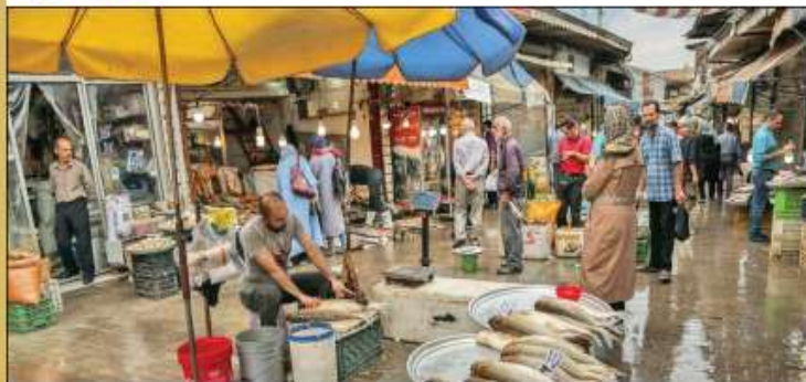
ماهی شمال روی موج گرانی

بازار گران ماهی تازه در مازندران، گیلان و گلستان به حذف تدریجی آن از سفره شب عید شمالی‌ها منجر شده است