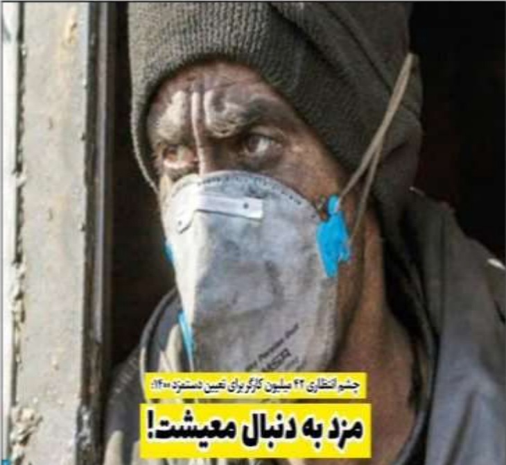
چشم‌انتظاری ۲۲ میلیون کارگر برای تعیین دستمزد ۱۴۰۰