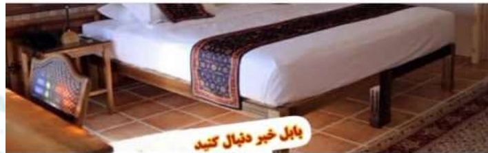
بابل خبر دنبال کنید

حیدری خاطرنشان کرد: پیش از این ۲۰ زندانی جرائم غیرعمد به برکت موقوفات استان آزاد شده بودند.