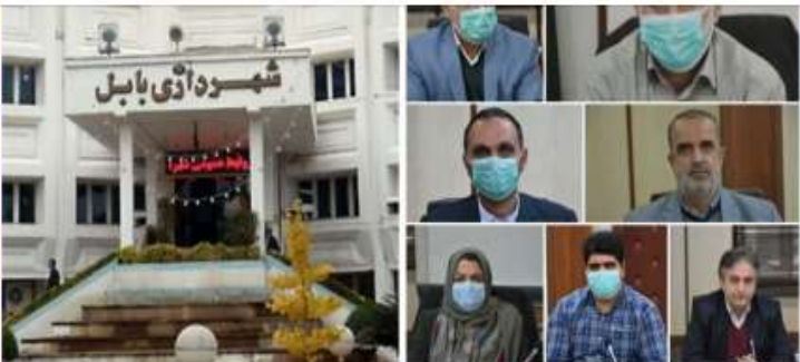
شورای بابل همچنان در بلا تکلیفی