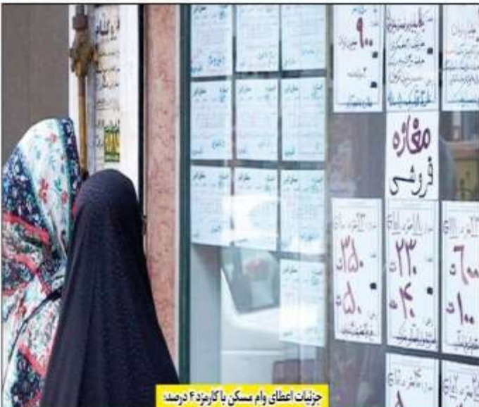
چیزیات اعضای وام مسکن با کاربرده ۶ درصد