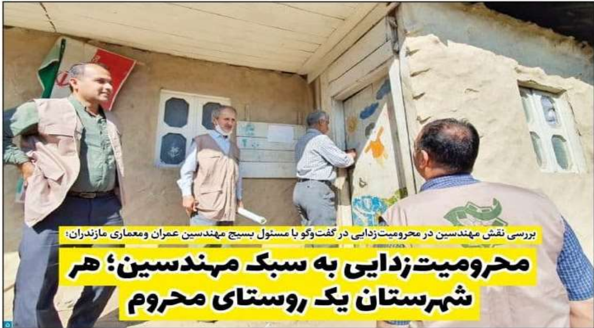
بررسی نقش مهندسين در محرومیت‌زدایی در گفت‌وگو با مسئول بسیج مهندسين عمران و معماری مازندران؛

محرومیت‌زدایی به سبک مهندسين؛ هر شهرستان یک روستای محروم