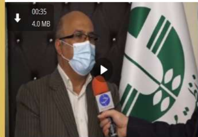
یک چهارم تالاب میانکاله (مازندران) خشک شد