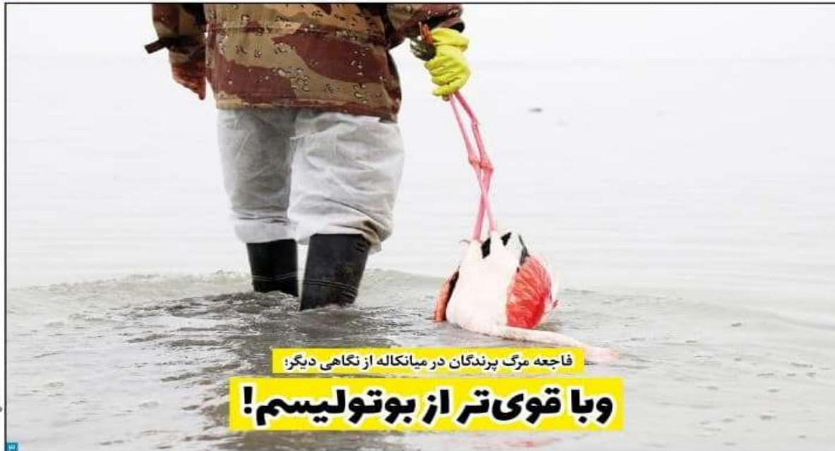
فاجعه مرگ پرندگان در میانکاله از نگاهی دیگر: