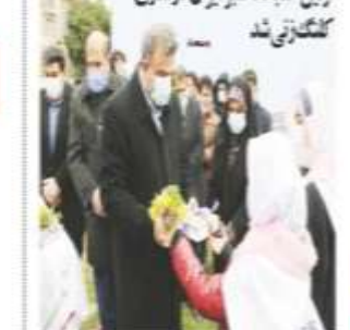
با حضور استاندار و سایر مسئولان محلی در مراسم اولین کتابخانه سبز ایران در ساری گفتگویی شد