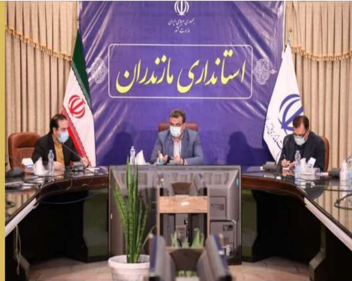
استاندار مازندران: ✓

تغییر رفتار مردم در مقابله با کرونا اقدام قابل توجه وزارت بهداشت بوده است