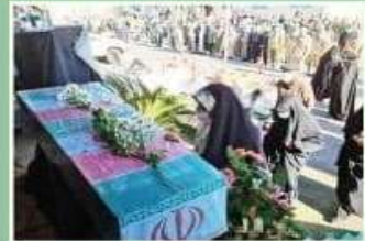
مازندران متبرک به عطر شهدا

سال یازدهم • یکشنبه • دهم اسفند ۱۳۹۹ شمسی • ۱۶ رجب ۱۴۴۲ قمری • ۲۸ فوریه ۲۰۲۱ میلادی • شماره ۳۰۲۱ • ۸ صفحه • ۱۰۰۰ تومان