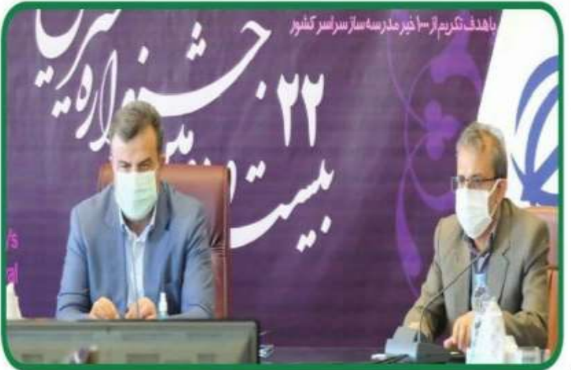
با هدف تقدیر از ۳۰ خیر مدرسه ساز سراسر کشور

با حضور استاندار مازندران؛ بیست و دومین جشنواره خیرین مازندران برگزار و از دو کتاب زندگینامه خیرین مدرسه ساز استان رونمایی شد.