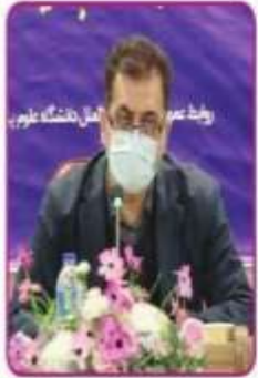
رئیس دانشگاه علوم پزشکی بابل میرداد

سرمايه گذاري ۳۰۰ ميليارد ريالي دولت در عرا كز در معاني بابل