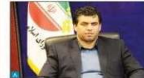
با حضور مسئولین چالوس افتتاح شد:

حضور هدفمند شهرداری آمل در نمایشگاه بین‌المللی گردشگری تهران